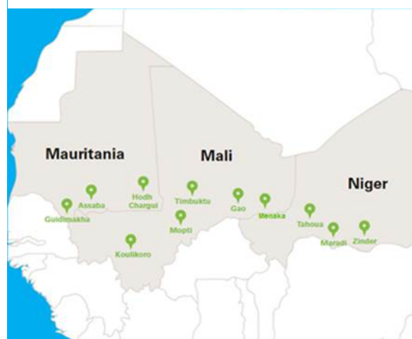
Figure 1 - Carte des lieux d'interventions du programme au Mali, en Mauritanie et au Niger