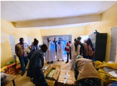
Distribution de manuels scolaire à Aghor

Zone d'intervention : Aghor – Mbéra II (Hodh Ech Chargui)