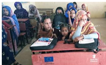
Classe passerelle (Camp de Mbéra)

Zone d'intervention : Gorgol – Camp de Mbéra (Hodh Ech Chargui).