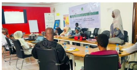
Formation sur la résilience psychologique des enfants

Zone d'intervention : Nouakchott - Nouadhibou