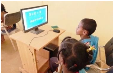
Espace TICE pour les enfants à l'école 3 de Mbéra

Dans le cadre de sa stratégie éducative, la Mauritanie a intégré les réfugiés dans son système éducatif national, tout